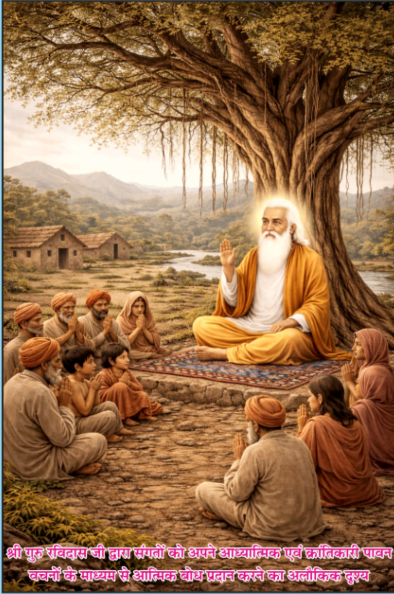
श्री गुरु रविदास जी द्वारा संगतों को अपने आध्यात्मिक एवं क्रांतिकारी पावन वचनों के माध्यम से आत्मिक बोध प्रदान करने का अलीकिक दृश्य

क्या आप जानते हैं? कैलिफ़ोर्निया ( अमेरिका ) से जनरल और आपके समाज की गतिविधियों से संबंधित दो साप्ताहिक समाचार पत्र हैं, जिनमें आप अपने मार्गदर्शकों के लेख तथा समाज से जुड़ी समाचार सामग्री प्रकाशित करवा सकते हैं : देश दुआबा ( पंजाबी ), Ambedkar Times ( अंग्रेज़ी ), Desh Doaba TV इन समाचार पत्र को आप वेबसाइट www.ambedkartimes.com पर पढ़ सकते हैं। Email: deshdoaba@yahoo.com Mobile and WhatsApp +1 916 947 8920