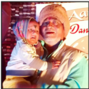
K T Balam Mochi Sahi Puri