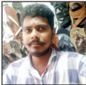
K Kamesh Mochi Sahi Puri