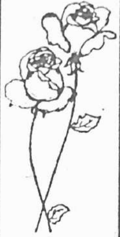
ਸ੍ਰੀ ਗੁਰੂ ਰਵਿਦਾਸ ਜੀ ਮਹਾਰਾਜ