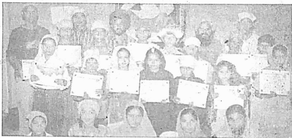
ਪਿੰਡ ਭੂੰਦੀਆਂ ਦੇ ਬੱਚਿਆਂ ਨੇ ਸੰਸਥਾ ਦੀ ਧਾਰਮਿਕ ਕਲਾਸ ਵਿਚ ਪੜ੍ਹਾਈ ਕਰਕੇ ਸੰਸਥਾ ਦੇ ਸਰਟੀਫਿਕੇਟ ਪ੍ਰਾਪਤ ਕੀਤੇ।