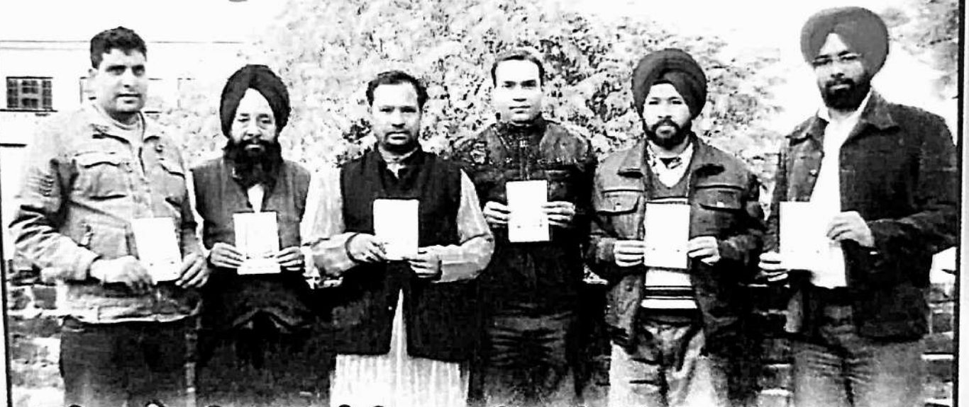
'ਸਤਿ ਭਾਖੈ ਰਵਿਦਾਸ' ਪੰਫਲਿਟ ਜਾਰੀ ਕਰਦੇ ਹੋਏ ਸੰਸਥਾ ਦੇ ਸਿਵਦਾਚ