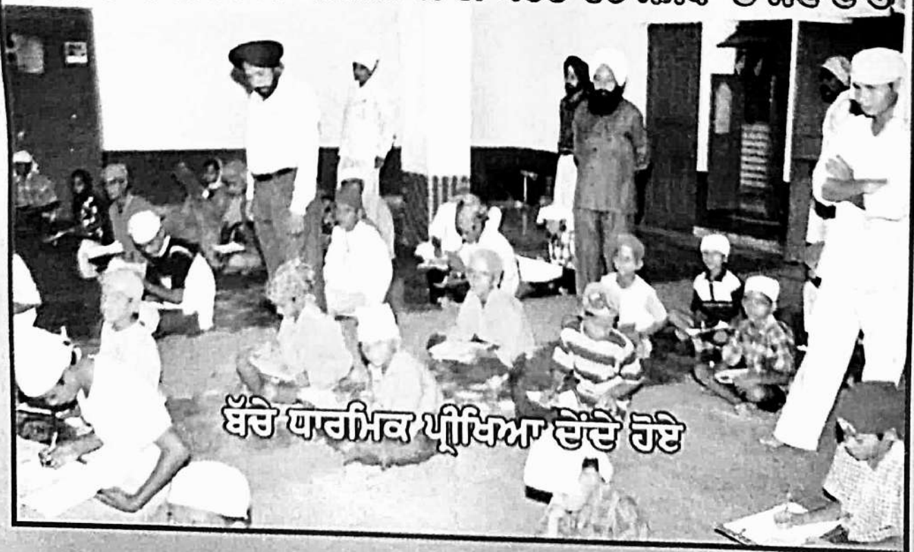
ਬੱਚੇ ਧਾਰਮਿਕ ਪ੍ਰੀਖਿਆ ਦੇਂਦੇ ਹੋਏ