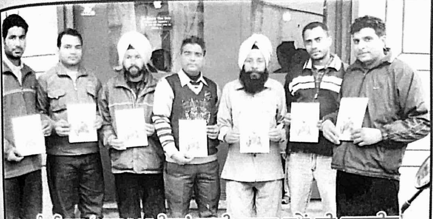
ਪੰਫਲਿਟ 'ਮਧੁਪ ਮਖੀਰਾ' ਜਾਰੀ ਕਰਨ ਸਮੇਂ ਦੀ ਤਸਵੀਰ