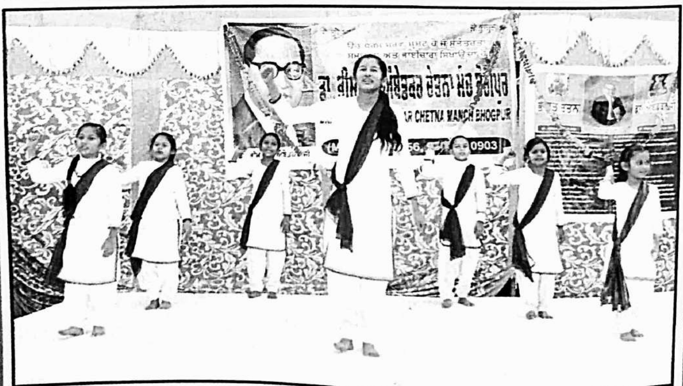
‘ਰਵਿਦਾਸ ਪਿਤਾ ਦੀਆਂ ਧੀਆਂ ਭੀਮ ਰਾਓ ਦੇ ਵਾਂਗੂੰ ਪੜ੍ਹਨਗੀਆਂ’ ਗੀਤ ਦੀ ਪੇਸ਼ਕਾਰੀ ਕਰਦੀਆਂ ਹੋਈਆਂ ਡਾ. ਭੀਮ ਰਾਓ ਅੰਬੇਡਕਰ ਚੇਤਨਾ ਮੰਚ ਭੋਗਪੁਰ (ਜਲੰਧਰ) ਦੀਆਂ ਬੱਚੀਆਂ।

Adampur Road, Near Railway Fatak, Bhogpur, Jalandhar. M.: 98159-63269, 70871-50013