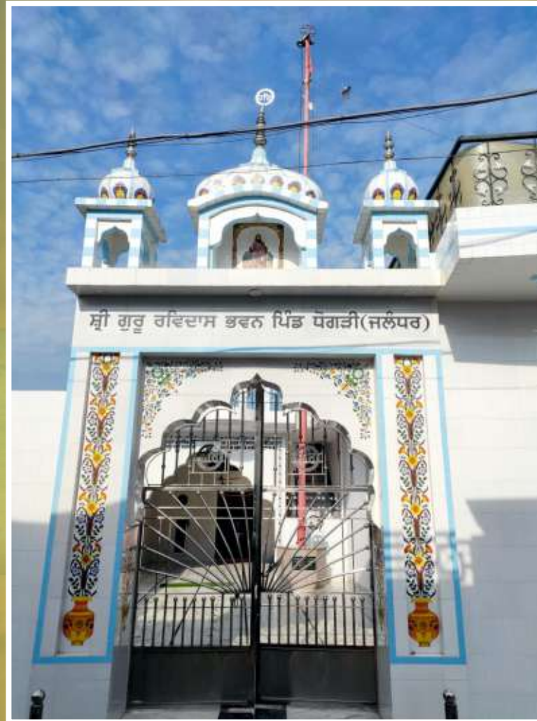
ਦਰਸ਼ਨੀ ਡਿਉਚੀ ਸ੍ਰੀ ਗੁਰੂ ਰਵਿਦਾਸ ਭਵਨ ਪਿੰਡ ਧੋਗੜੀ (ਜਲੰਧਰ)