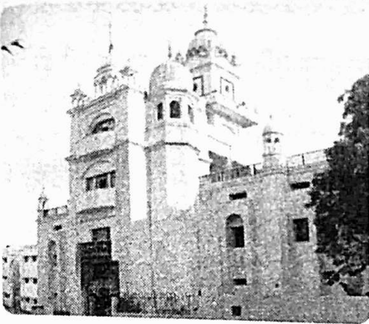
ਸ੍ਰੀ ਗੁਰੂ ਰਵਿਦਾਸ ਜਨਮ ਅਸਥਾਨ ਸੀਰਗੋਵਰਧਨਪੁਰ ਵਾਰਾਨਸੀ (ਕਾਂਸ਼ੀ)